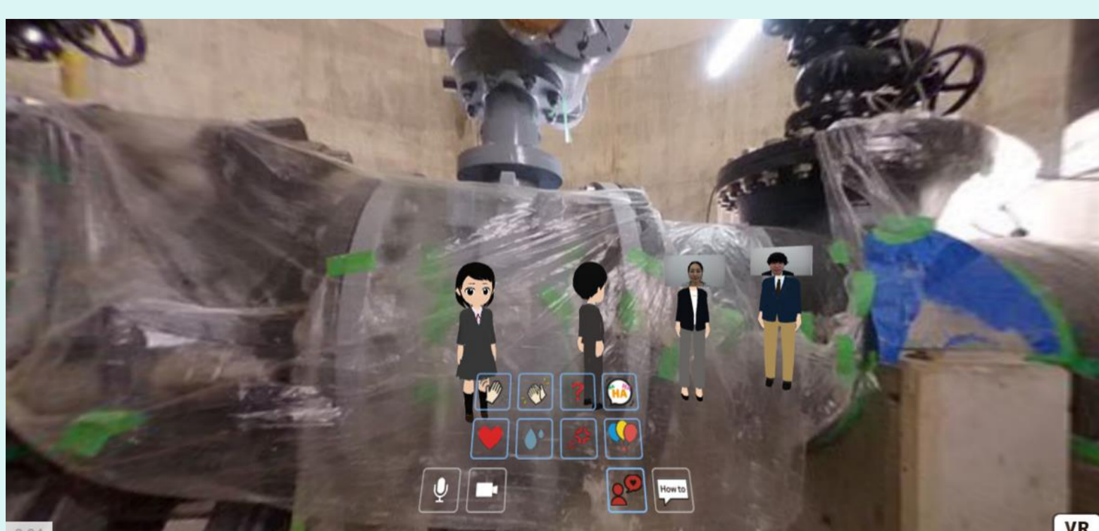
VRでの工事中の立坑紹介