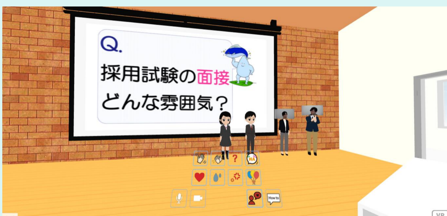
VR職員インタビュー会場

なお、VRゴーグルは不要です。サイト内の入口ボタンをクリックするだけで気軽に体験できる仕組みになっています。