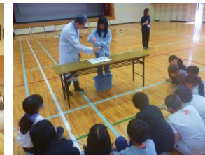
【グループワーク】浄水処理実験